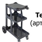
Тележка (арт. 040120)

Чтобы нагреть и выправить шасси автомобиля за несколько минут. Этот метод позволяет нагреть четко ограниченную зону.