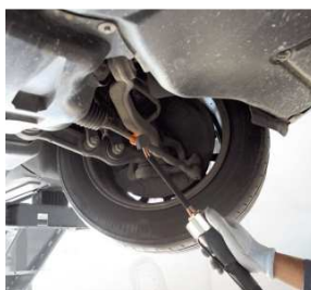
Раскрепления продольной рулевой тяги